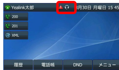
ヘッドセットモード